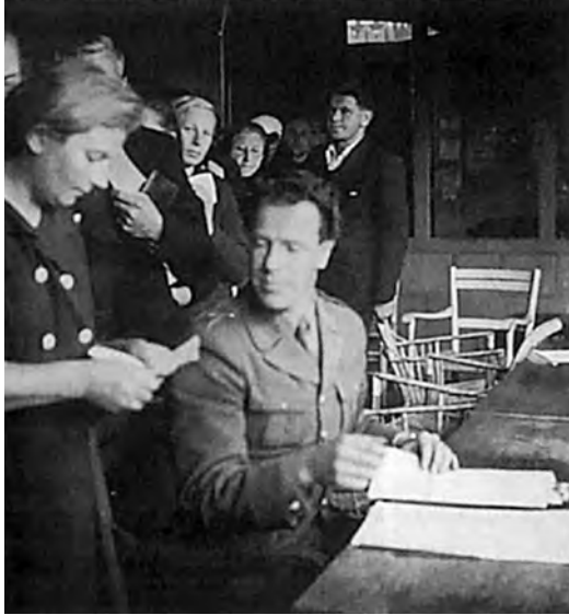
Bild 20. För lägercheferna ville dygnets timmar inte räcka till för att hjälpa alla flyktingarna tillrätta.

Det var naturligtvis inte alldeles lätt att under lång tid hålla så många människor med mat. Svenskarna själva hade fått lära sig att leva med ransoneringskort och betydligt sänkt levnadsstandard. Men på något sätt klarade man av de tusentals nya munnar som skulle mättas i lägren. På brunnsorterna och vid de stora hotellen, där klarade man av mathållningen på egen hand inom den givna ekonomiska ramen. För de mindre lägren runt om i landet utarbetade man i Stockholm veckomatsedlar med förslag på vad som lämpligen kunde serveras. Det hela tycks i stort sett ha fungerat väl. Vid mitten av februari 1945 inspekterades åtta av utlänningskommissionens läger och mathållningen godkändes utan anmärkningar. I Skälderviken hade flyktingarna klagat på maten, som inspektörerna då provvat utan att finna några fel. Det visade sig att ett par personer, lagda för kverulans, hade fått de andra med sig i sina klagomål. När den huvudsakliga källan till missnöje blivit förflyttad till ett annat läger, återställdes lugnet. 266 Såväl vid inspektionen som vid andra tillfällen förklarade flyktingarna att de var nöjda med maten vilket inte hindrade att de sinsemellan hade en del att säga om svensk kokkonst. Svenskarna hade en benägenhet att söta maten, isynnerhet brödet, något som esterna hjärtligen avskydde, vana som de var vid osötat bröd och surkål.