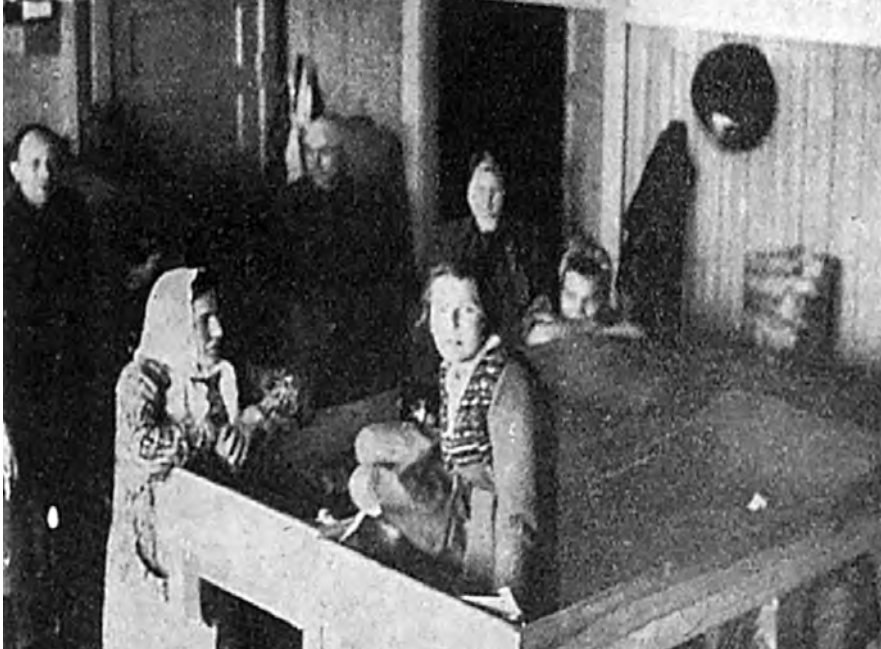
Bild 19. Också i de mera permanenta lägren fick man leva under primitiva förhållanden. Foto i Eesti põgenikud Rootsis.

Nästa steg blev att flyktingen fick fylla i en ny blankett med ansökan om att få svenskt främlingspass. Blanketten var utställd av Statens utlänningskommission och förtryckt på svenska och estniska och uppgifterna var flera än på den enkla inreseuppgiften. Dessa blanketter skickades in till utlänningskommissionen som skulle skriva ut passen. Men här blev det sedan stopp. I slutet av september och början av oktober hade det inom loppet av ett par veckor kommit in mer än 36 000 flyktingar från Baltikum. De var utspridda över Gotland och stora delar av Ostkusten. På kommissionen arbetade ett 70-tal personer dag och natt med att skriva ut pass. Många tjänstemän blev sjuka av överansträngning och totalt uttröttade skrivmaskinsflickor föll i gråt av trötthet på nätterna. 254