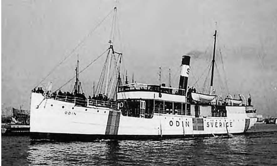
Bild 3. "Odin" eller "Den svenske kungens vita skepp", som hon också kallades, överförde hösten 1943 mer än 700 estlandssvenskar, mest gamla och sjuka, till Sverige.

Till transporterna användes ångfartyget "Oden" som under tre resor den 27 november samt den 7 och 17 december 1943 tog över 738 personer efter de listor som Mothander gjort upp i samråd med en representant för generalkommissarie Litzmann och en SD-man som sades företräda den estniska regeringen eller direktoriet. Fartygets ankomst- och avgångstider var noga reglerade med tanke på att all sjöfart var hårt styrd av den tyska marinen, och det krävdes mycket organisatoriskt arbete att få de rätta passagerarna att infinna sig för avgång på rätt tid och rätt plats. 52