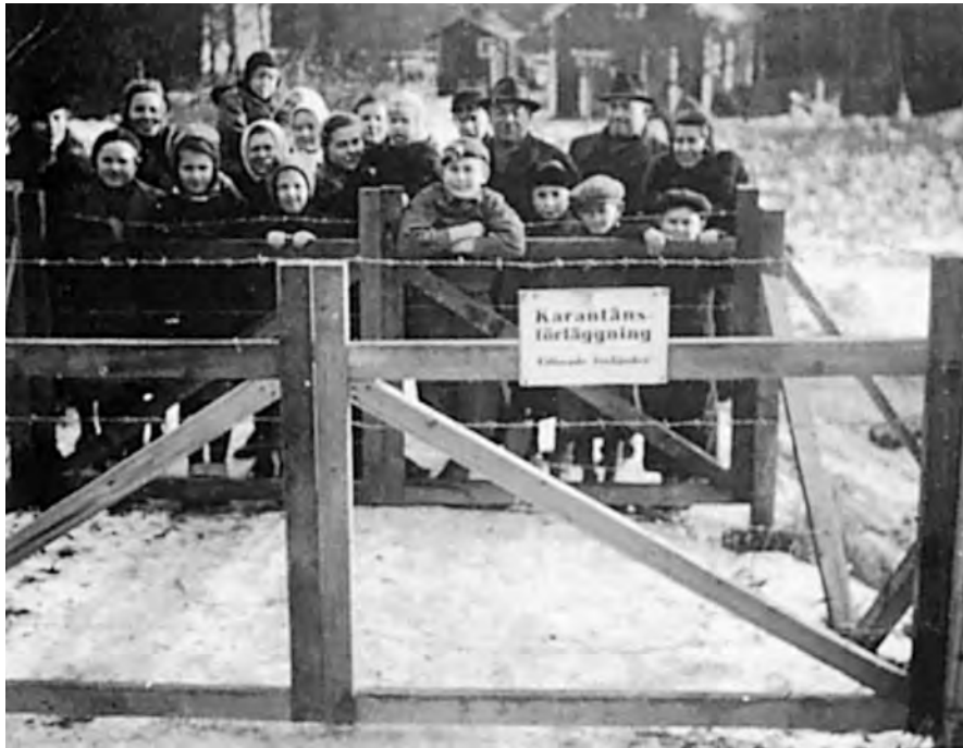
Bild 21. Minst 14 dagar fick flyktingarna tillbringa bakom taggtråd i karantänslägren, detta med tanke på smittofaran. Bilden från Västervik hösten 1944. Foto i Bernard Kangro, Estland i Sverige.

lägervistelsen. Det största problemet var bristen på lämplig sysselsättning. Kortspel och supande kunde bli ett sätt att fördriva tiden och tristessen. Från svensk sida såg man problemen och oroade sig särskilt för ungdomarna och för de intellektuella som hade isolerats från sin invanda miljö. Möjligheterna att hjälpa dem inom ramen för en lägervistelse var dock begränsade och det främsta målet för flyktingpolitiken blev därför att så snabbt som möjligt avveckla lägren och på våren 1945 hade de allra flesta estniska flyktingarna kommit ut i det svenska samhället och nu blev det en sak för Skolöverstyrelsen och för Statens arbetsmarknadskommission att svara för deras anpassning till det nya landet.